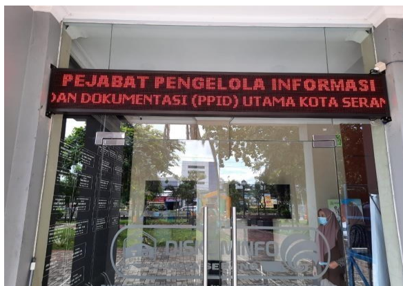
GAMBAR 2.1 SEKRETARIAT PPID PEMERINTAH KOTA SERANG